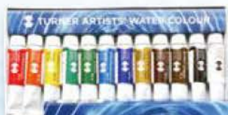
透明水彩絵具5ml 12色セット